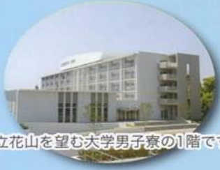
立花山を望む大学男子寮の1階です