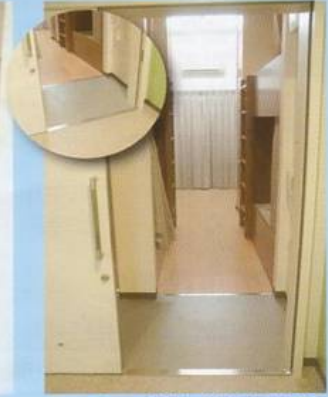
車いす対応宿泊室(1室)