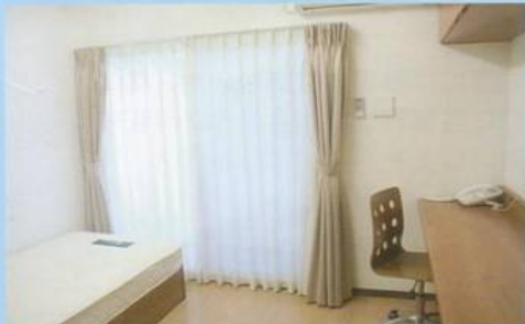
(引率者室はシャワー・トイレ完備)